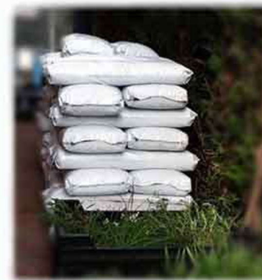
Extensief mineraal daksubstraat Verpakking: 20l Korrelgrootte: max 16mm oa lava, puimsteen, augiet, limoriet, ...