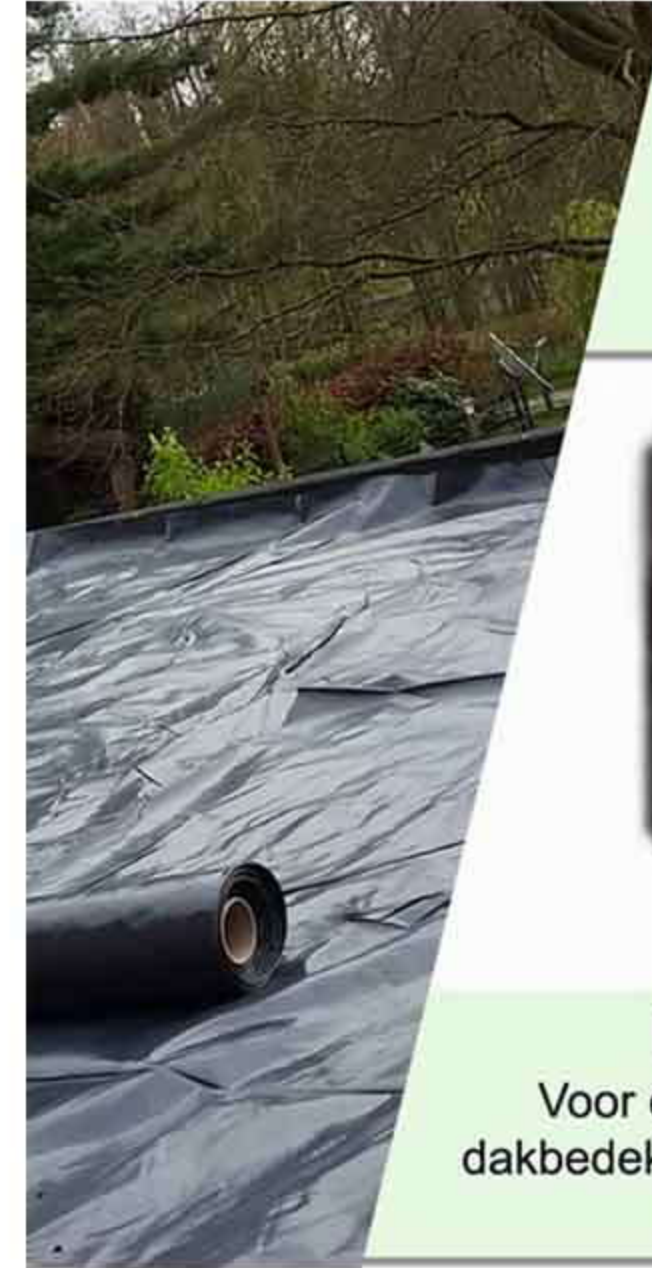
Wortelwerende HDPE folie

Als de dakbedekking wel wortelwerend is (vb EPDM, Resitrix) plaatst dan het beschermdoek.