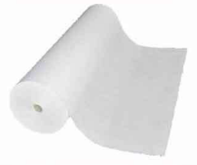
Niet geweven geotextieldoek Voor een wortelwerende dakbedekking.