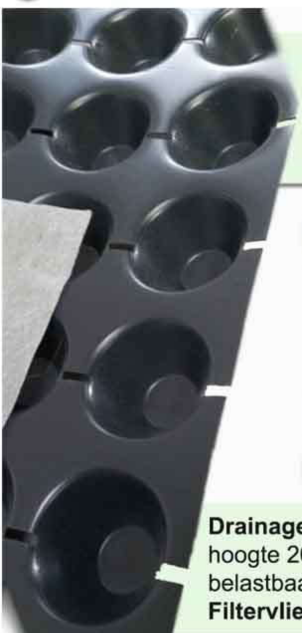
Drainage en filterdoek