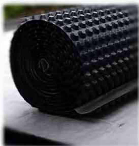
Drainage: HDPE, Wateropslag 6 l/m 2 , hoogte 20mm, afvoersleuven 3mm, belastbaar 240kg/m 2 Filtervlies: Geotextiel met PP-vezels