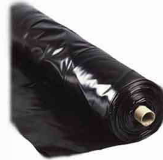
HDPE wortelfolie Voor een niet wortelwerende dakbedekking (de meeste bitumen). Rolbreedte 4 m.